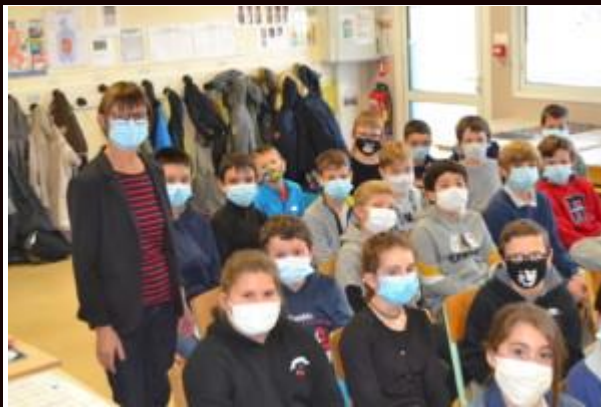
MERCI Mme Pouteau, à bientôt !